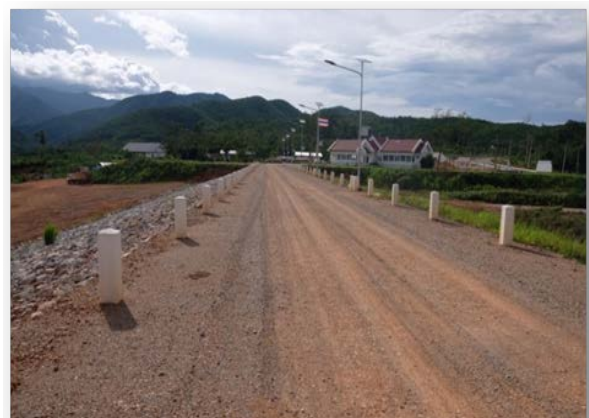
รูปที่ 1.6-1 ทำนบกั้นดินปิดช่องเขาต่ำและอาคารประกอบ