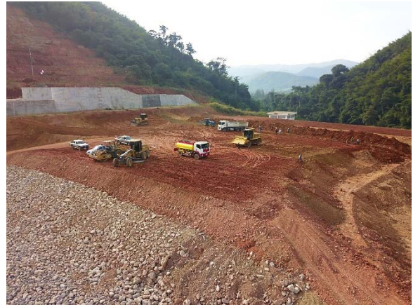
รูปที่ 1.6-2 ทำนบกั้นดินเขื่อนหลัก