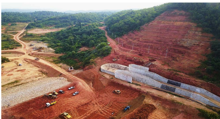
รูปที่ 1.6-3 อาคารระบายน้ำล้น